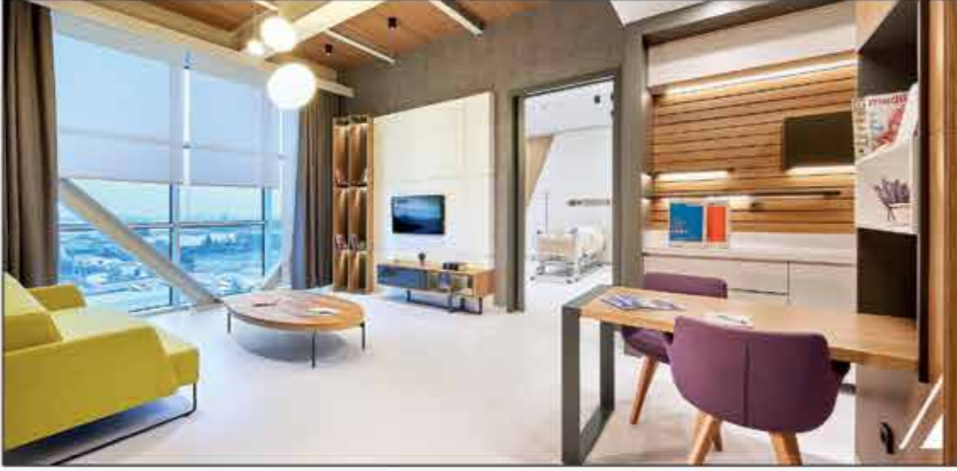
VIP Hasta Odası