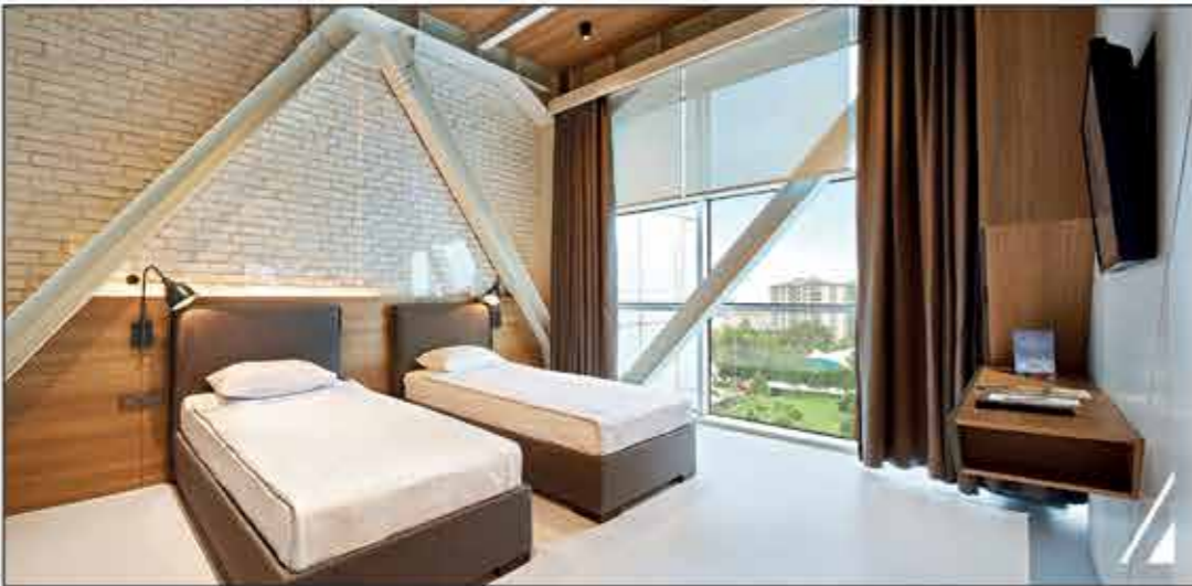
VIP Hasta Odası