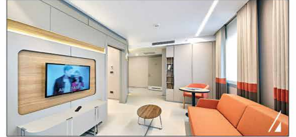
Suit Hasta Odası