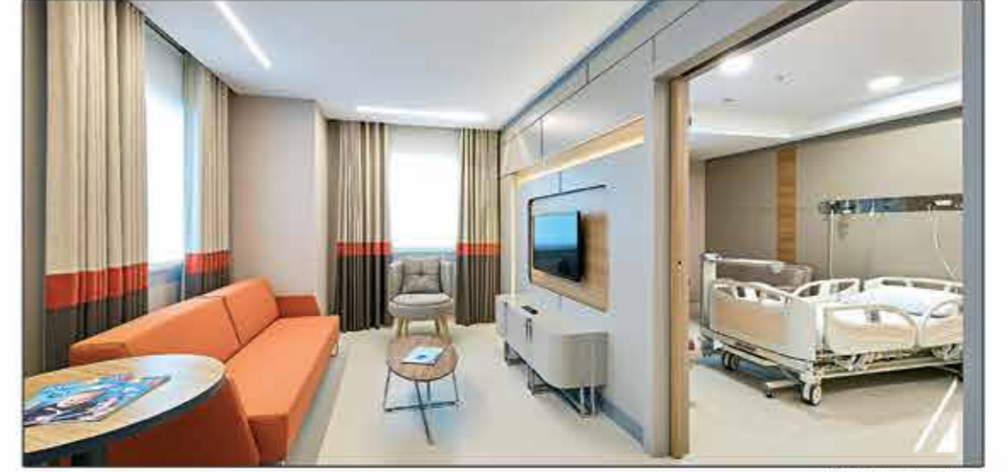
Suit Hasta Odası