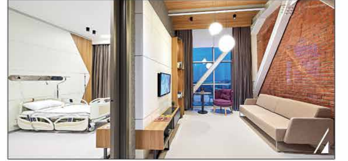
VIP Hasta Odası