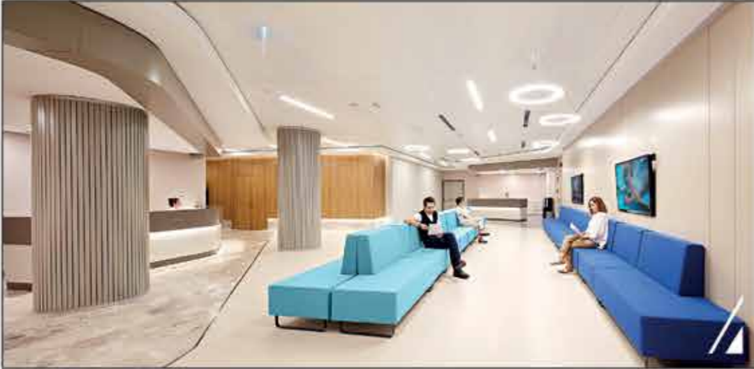
Poliklinik Servis Bekleme