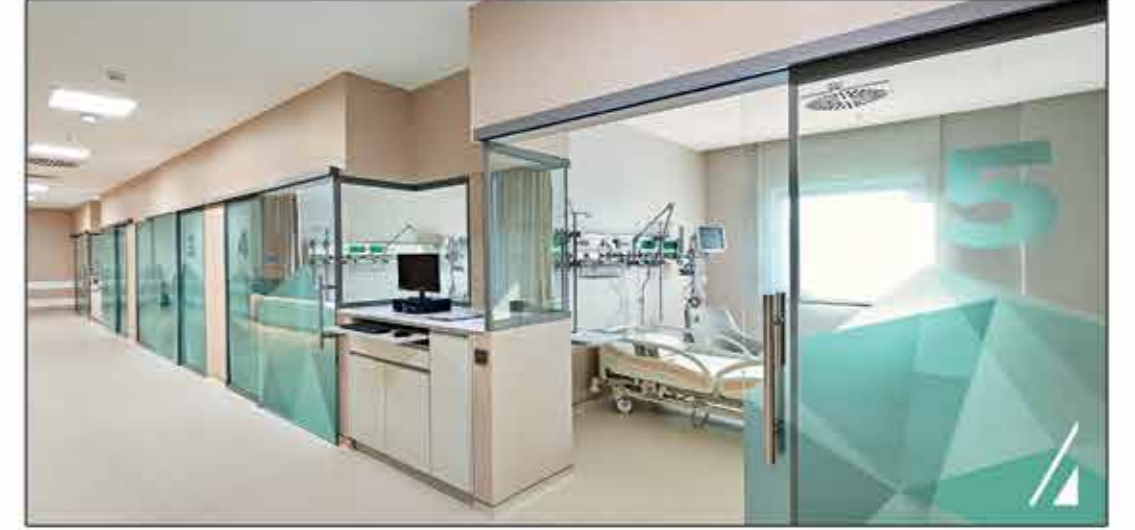
VIP Yoğun Bakım