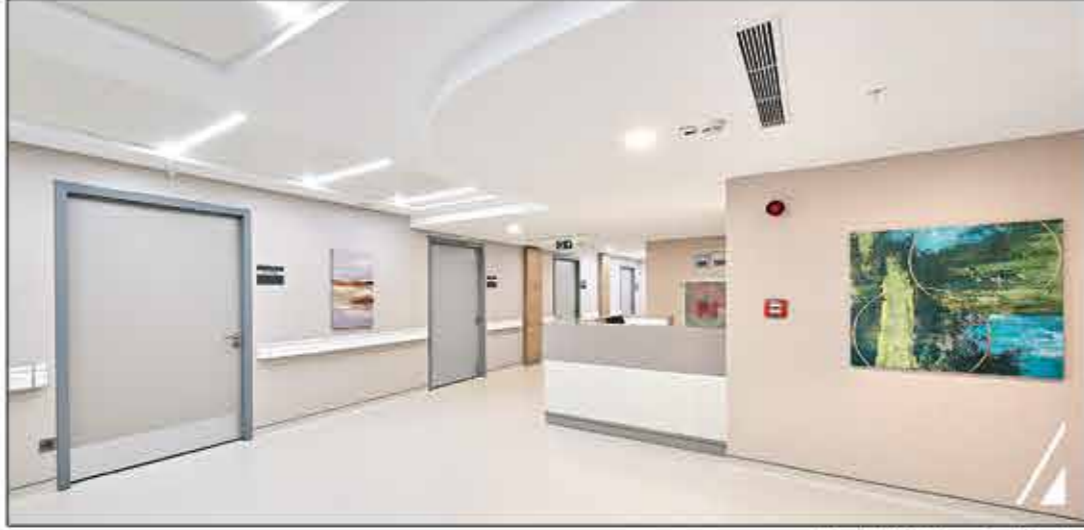
Hasta Katı Hemşire Banko