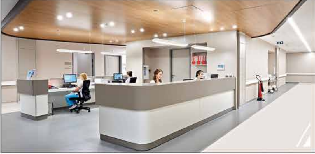
Hasta Servis Hemşire Banko