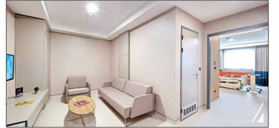
Suit Hasta Odası