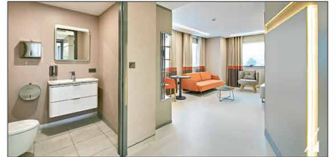
Suit Hasta Odası