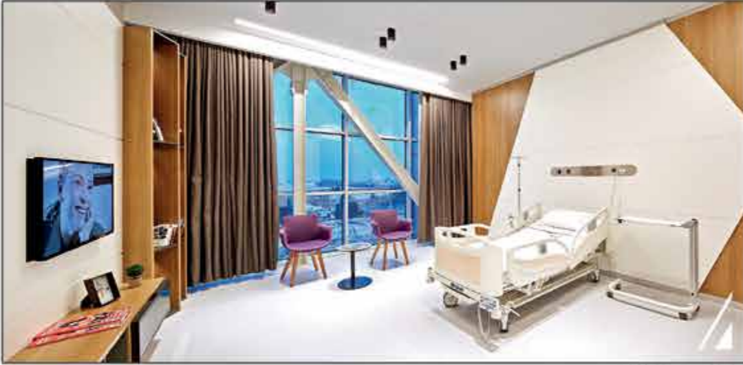
VIP Hasta Odası